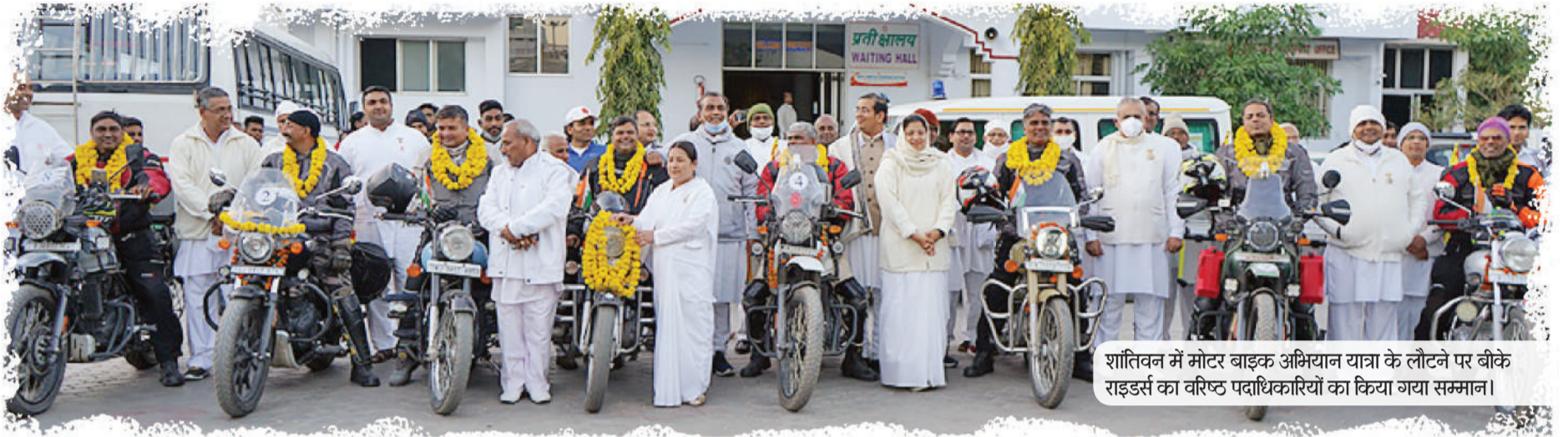
शांतिवन में मोटर बाइक अभियान यात्रा के लौटने पर बीके राइडर्स का वरिष्ठ पदाधिकारियों का किया गया सम्मान।

‘एक भारत-श्रेष्ठ भारत’ मोटर बाइक अभियान: आबू रोड से गुरुग्राम का सफर किया तय